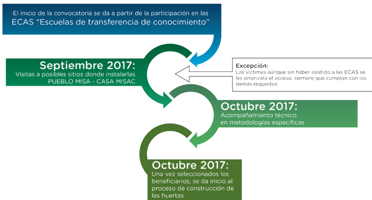
Ilustración 2. Ruta para la implementación de huertas

Esta estrategia se basa a partir del modelo de núcleo productivo, el cual tendrá dos fases: una es la implementación de invernaderos con sistemas hidropónicos para la producción de hortalizas de hoja ancha y una segunda será la implementación de huertas satélites ubicadas en zonas geográficamente cercanas a los invernaderos, en propiedad de miembros de la comunidad educativa (padres de familia, vecinos de las instituciones educativas, estudiantes) y demás vecinos del sector. Dentro de los criterios de selección tendremos como prioridad a quienes acrediten ser población víctima del conflicto armado y grupos de población vulnerable, de los cuales se espera contar al menos con un 25% de beneficiados.