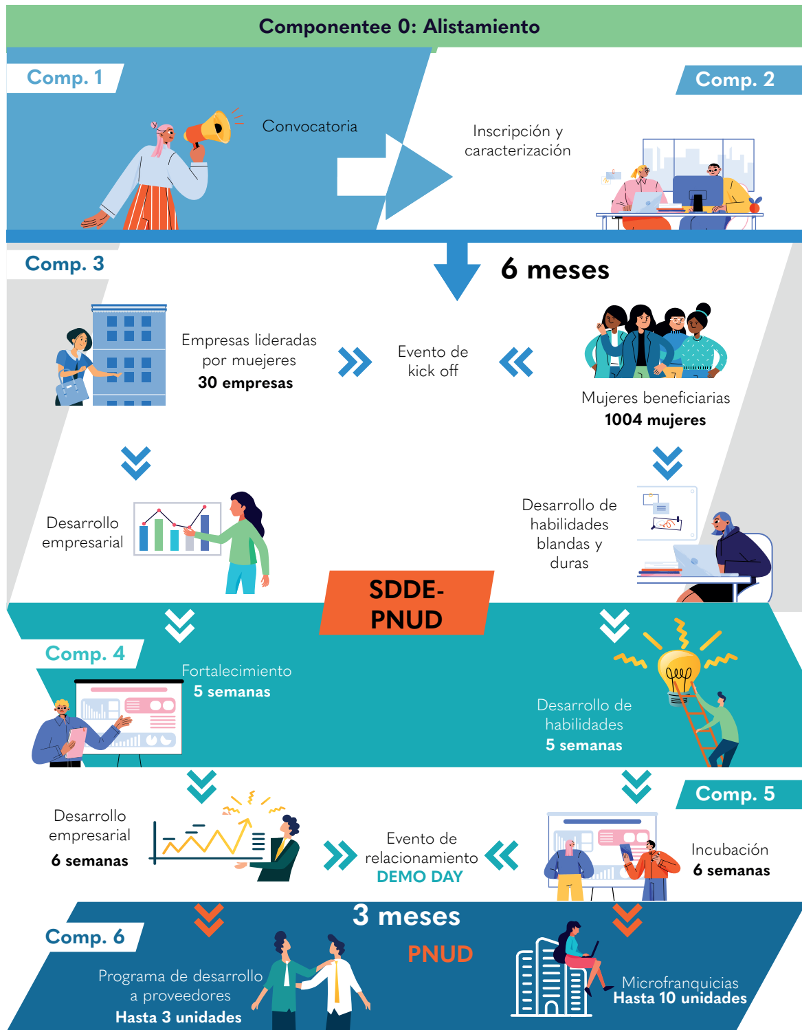
Figura 1. Aproximación al Programa Creo en Mí desde el punto de vista de sus componentes y actividades