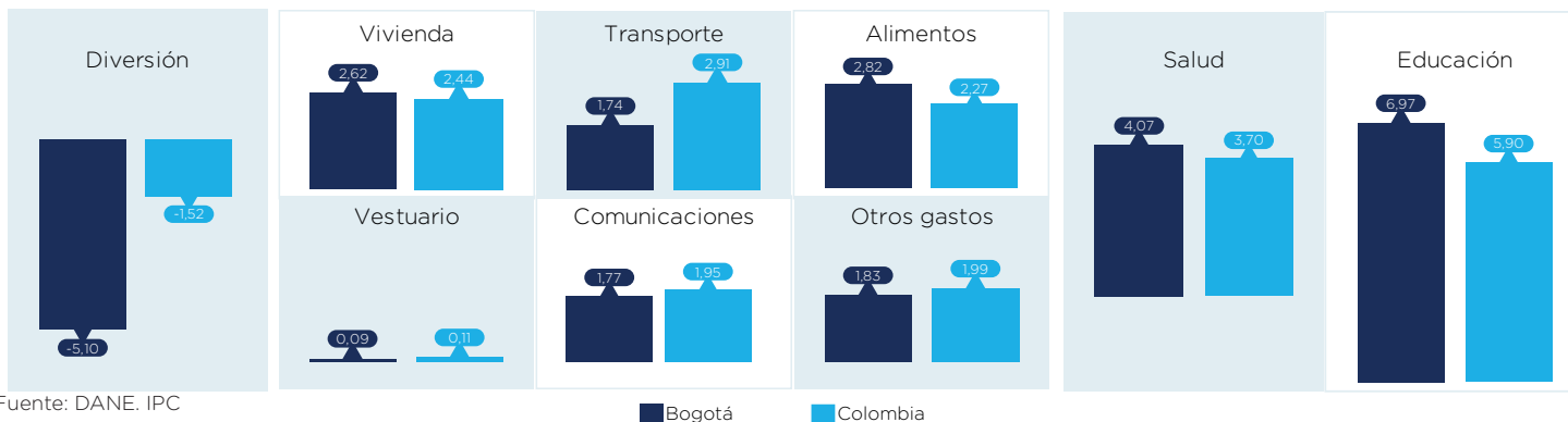
Variación año corrido IPC Bogotá y Colombia por Grupo de gasto, Ingreso promedio Porcentaje, junio de 2018