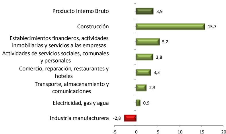
Gráfica 1. Tasa de crecimiento por actividades. Bogotá 2015