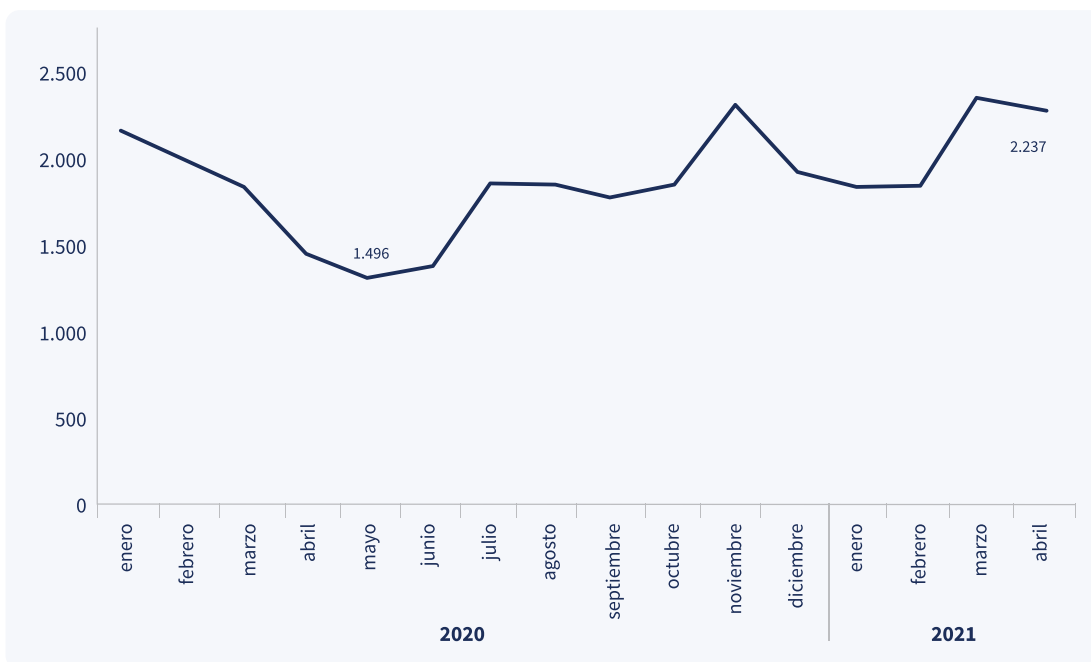
Importaciones de Bogotá provenientes del exterior, abril 2020-2021p.

p: cifras provisionales en millones de dólares US$ Fuente: DIAN, importaciones, elaboración SDDE-ODEB