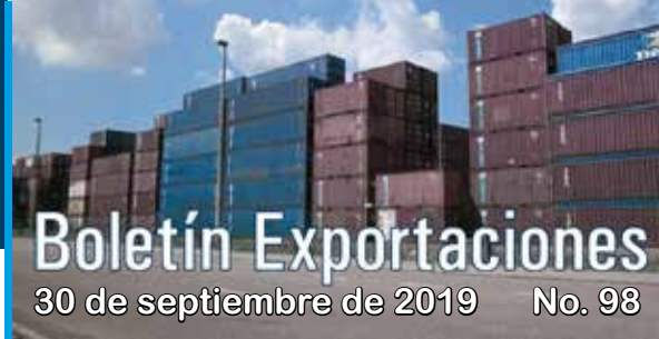
Participación según actividad económica de las exportaciones de Bogotá en julio de 2019