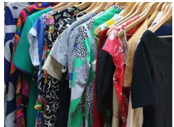
Los textiles y prendas de vestir registraron una variación real en las ventas de 9.4% durante el cuarto trimestre de 2013.