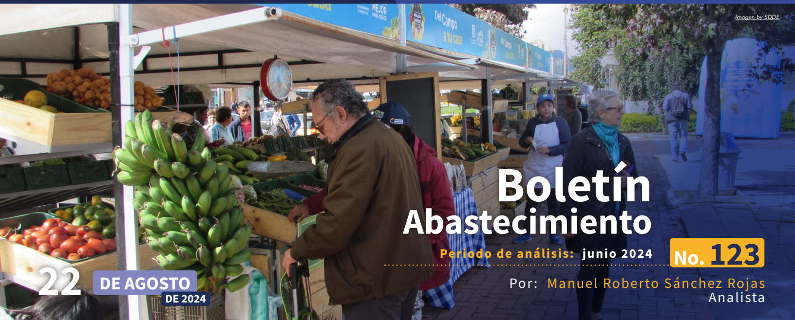
Imagen by SDDE