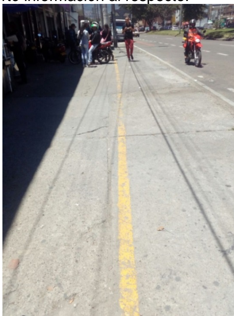
Franja amarilla de espacio público (Izquierda: paso de peatones; Derecha: parqueo) Lo que se ve en la foto es lo contrario a lo que se pretende con esa franja.

Para un 7,7% resultaría fundamental que se logren acuerdos con la Policía de Tránsito y las autoridades de movilidad en términos de parqueo y exhibición de motos. Un 2,2% no reportó información al respecto.