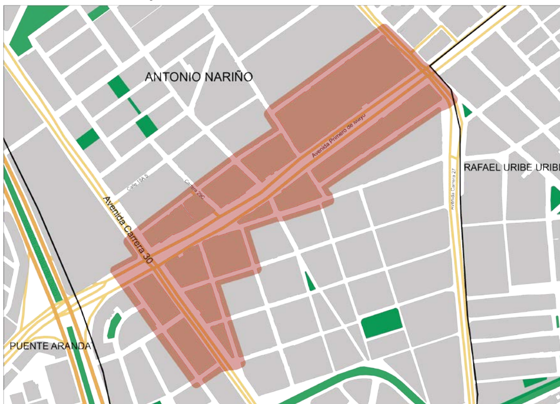
Mapa 1: Comercio de motos - Calle 22 sur