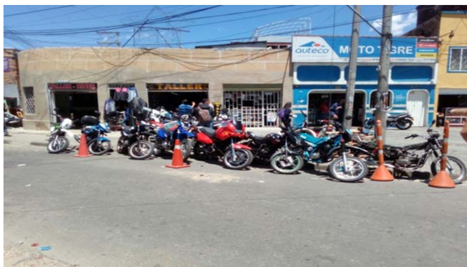
Parqueo en espacio público para exhibición de motos. Foto: SDDE – DEDE.

Fuente: SDDE – DEDE. Encuesta a empresarios de motocicletas