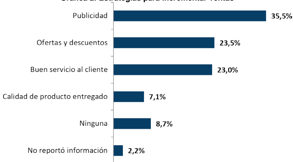
Gráfica 2: Estrategias para incrementar ventas