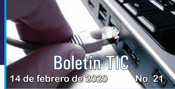
Índice de penetración - internet