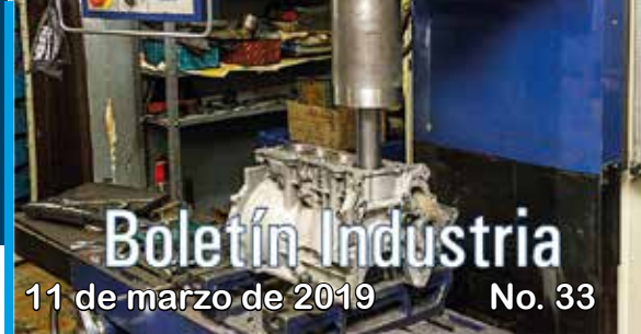
Producción industrial. Variación anual III trimestre de 2018.