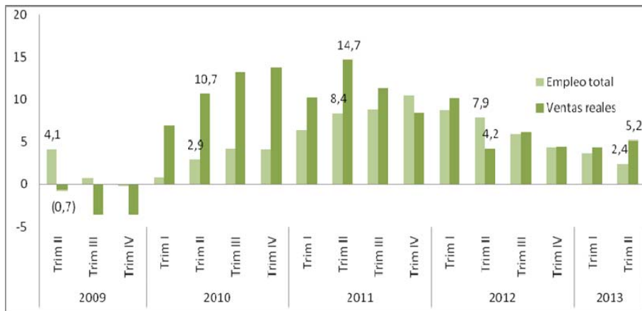
Ventas al por menor y empleo en Bogotá Variación anual del trimestre (%)