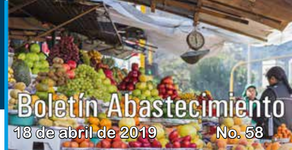
Abastecimiento Bogotá por grupo de alimentos, 2016 - 2018